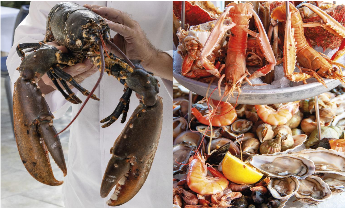
TABLE DE L'ERMITAGE

Breton blue lobster & Seafood platter on request 48 hours sur commande 48h avant*