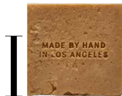
1 Manuka Soap Brick, € 58 FLAMINGO ESTATE 2 Kruk Le Sorbet, € 3509 HAUVETTE MADANI 3 Fragrance Est. 1947 € 9,99 H&M 4 Eyre Bath Mat Ivory, € 60 BAINA 5 Kamerscherm Traces Between Folding and Unfolding, € 1450 JINSEON AHN 6 Sofa Ono, € 4950 ANN DEMEULEMEESTER X SERAX 7 Spiegel Dora, € 1130 RACHEL DONATH 8 Rivet Box Table, € 920 FRAMA 9 Strandhanddoek Alee, € 85 FIRM LIVING